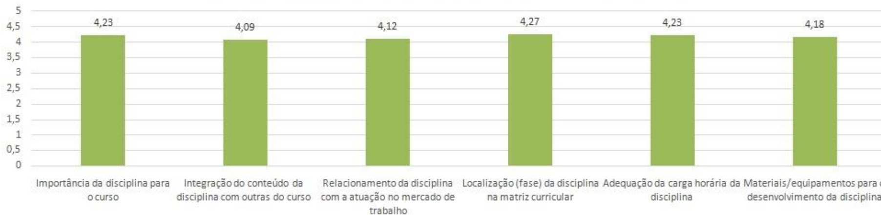
Média da Avaliação das Disciplinas - Engenharia de Software - ESO-ESO