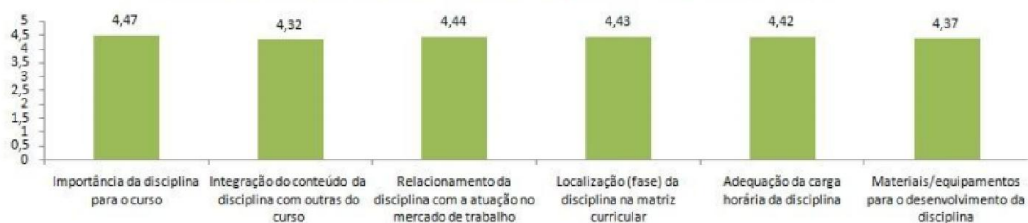
Média da Avaliação das Disciplinas - Ciências Contábeis BCC-BCC

Tendo em vista a avaliação das disciplinas realizada pelos discentes, a nota global do item avaliado foi 4,41. A avaliação da “ Importância da disciplina para o curso ”, obteve a maior nota dentro do grupo de perguntas, com 4,47 pontos de um total de 5. Isso significa que a matriz curricular,